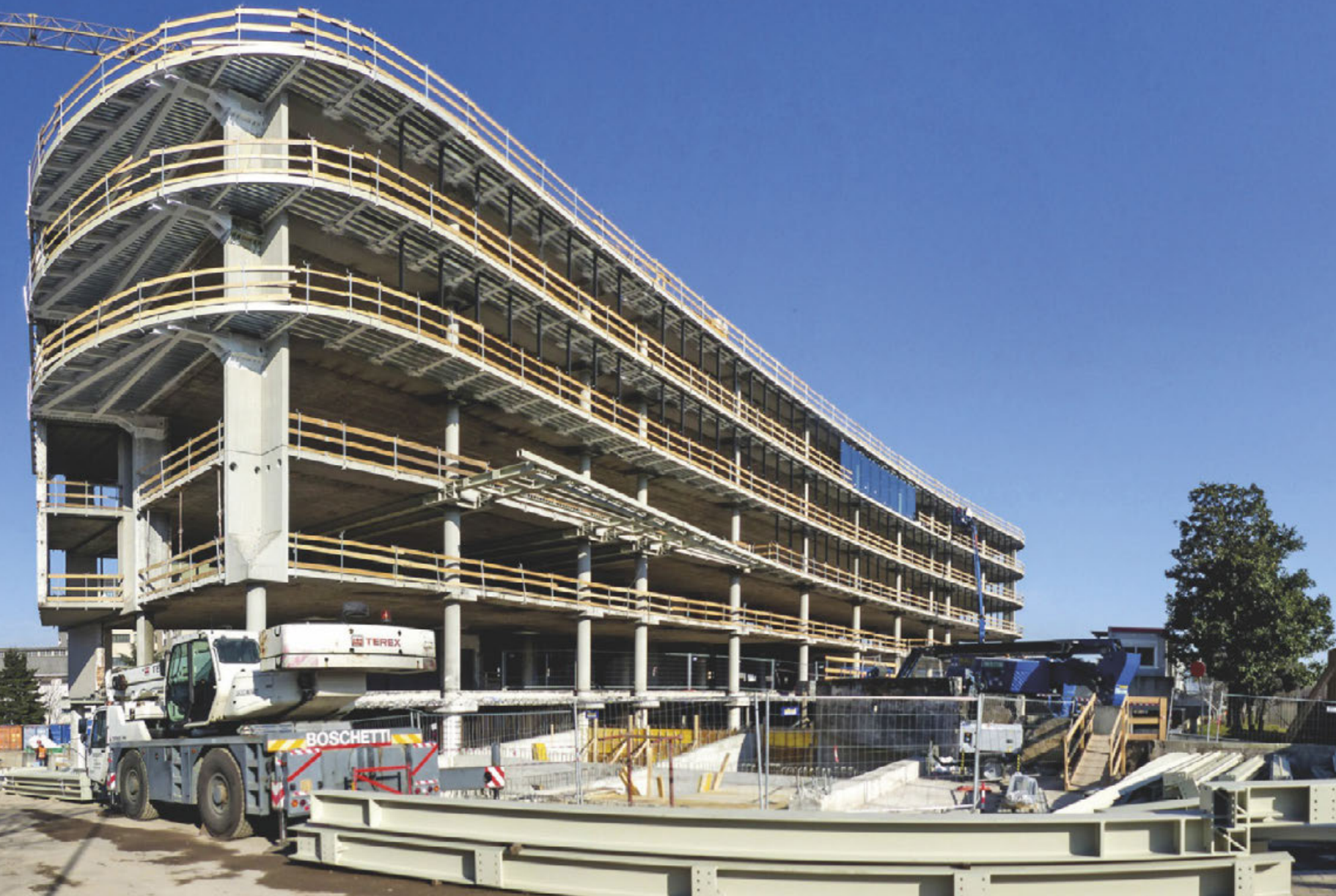
La fase iniziale dell'installazione delle vetrate, partendo dalla fascia centrale in quota del prospetto, ha consentito il controllo dimensionale dei giunti in fase di montaggio. Il cantiere ha previsto una parziale sovrapposizione tra la fase di completamento delle estensioni delle solette e l'inserimento dei primi elementi vetrati in quota The first phase of installing the glazing, starting from the central raised band on the façade, permitted dimensional control of the joints during mounting. The site called for partial overlap between the completion phase of the extensions of the floor slabs and insertion of the first elevated glazed elements